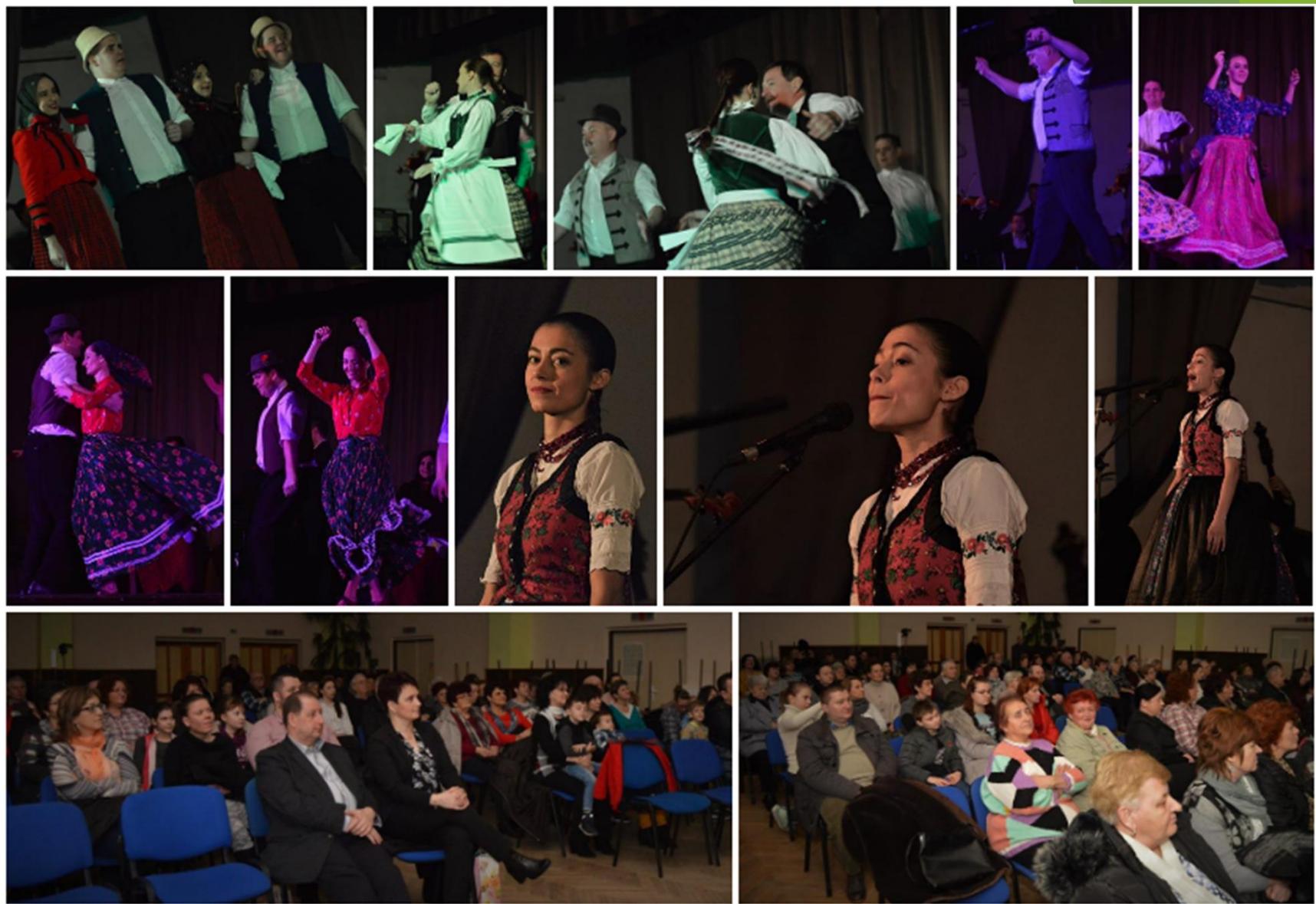
▶ A SZÖTTES Kamara Néptáncgyűttes fellépése