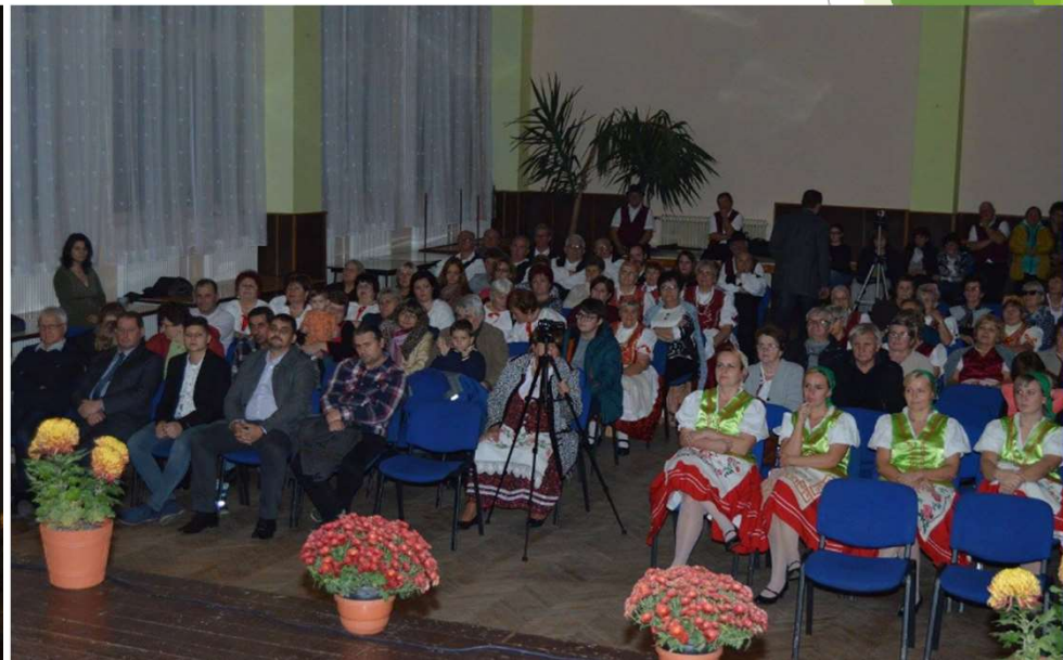
► Gortva - völgyi Hagyományőrző Ünnepség