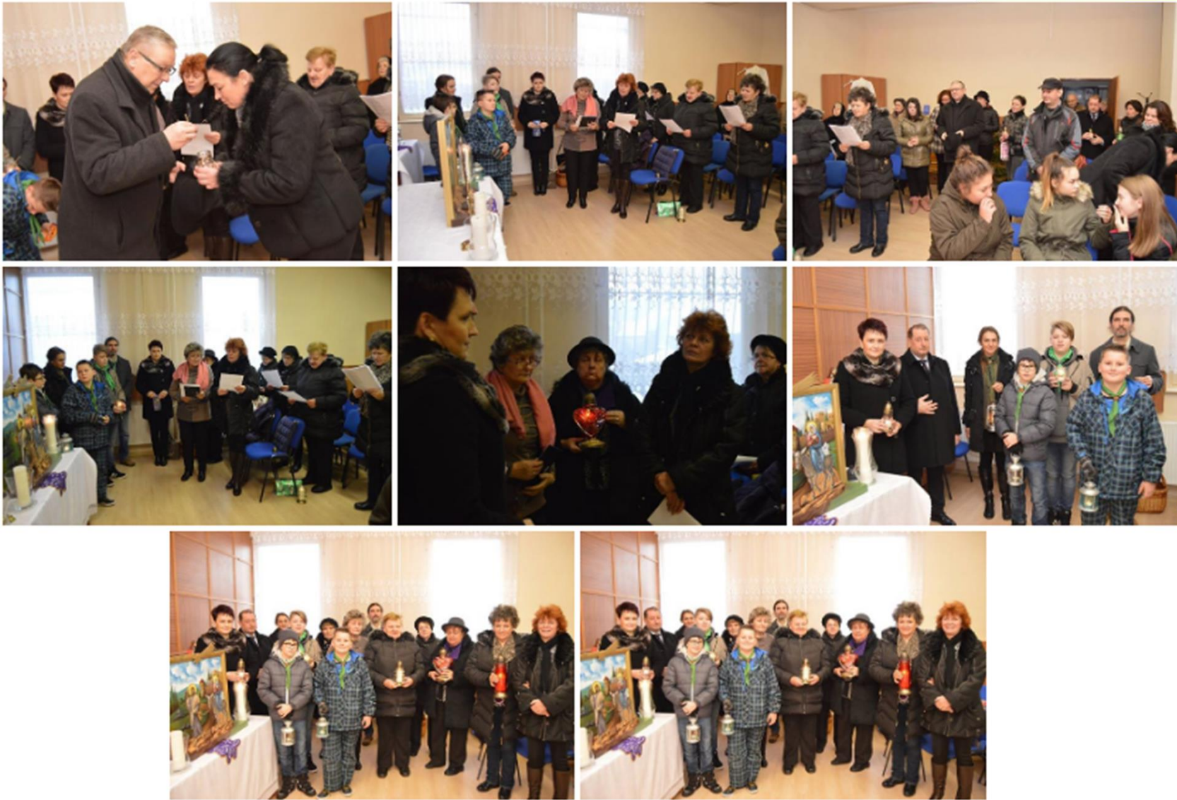
► A Betlehemi békeláng fogadása