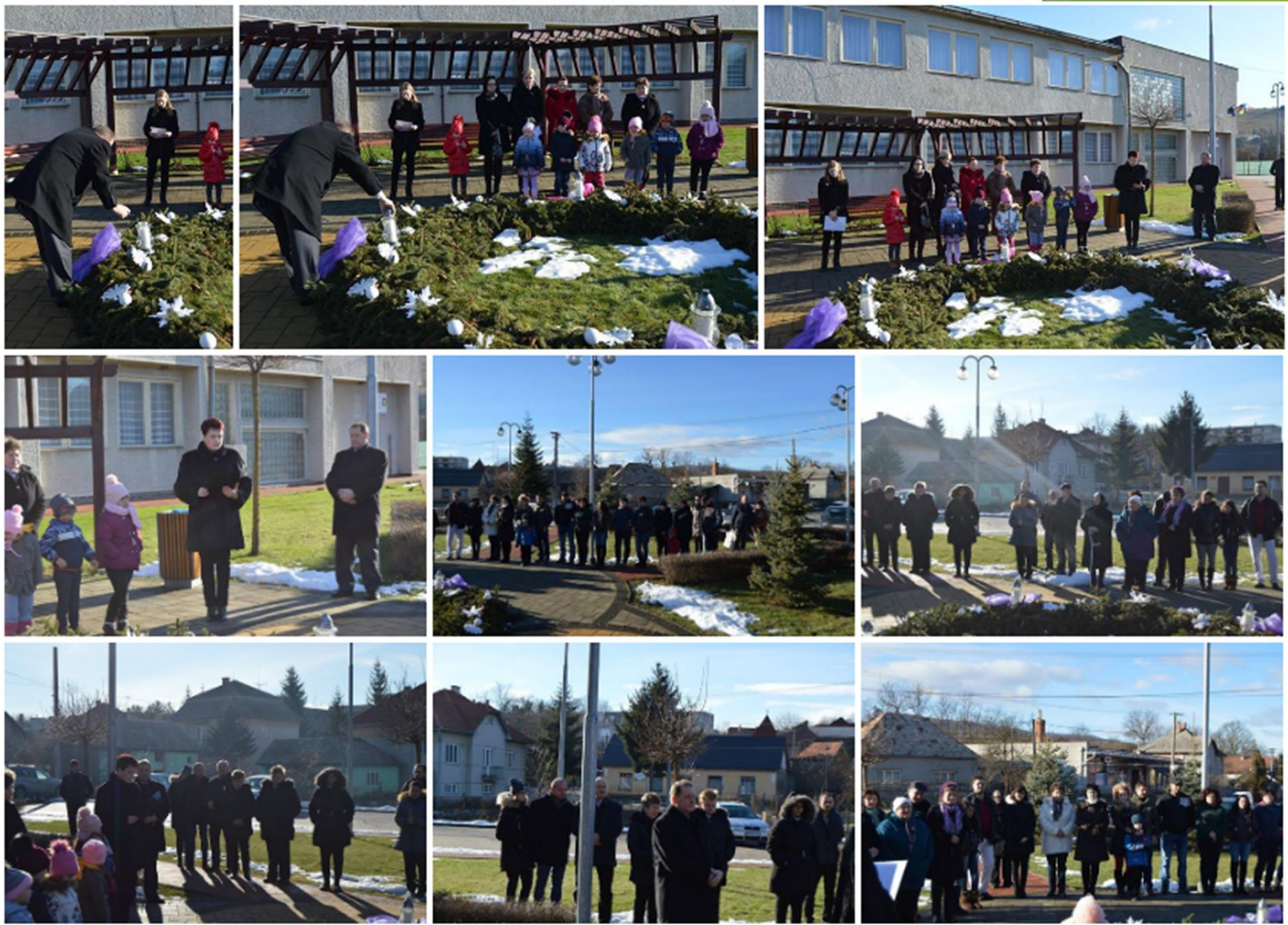
▶ Adventi gyertyagyújtás