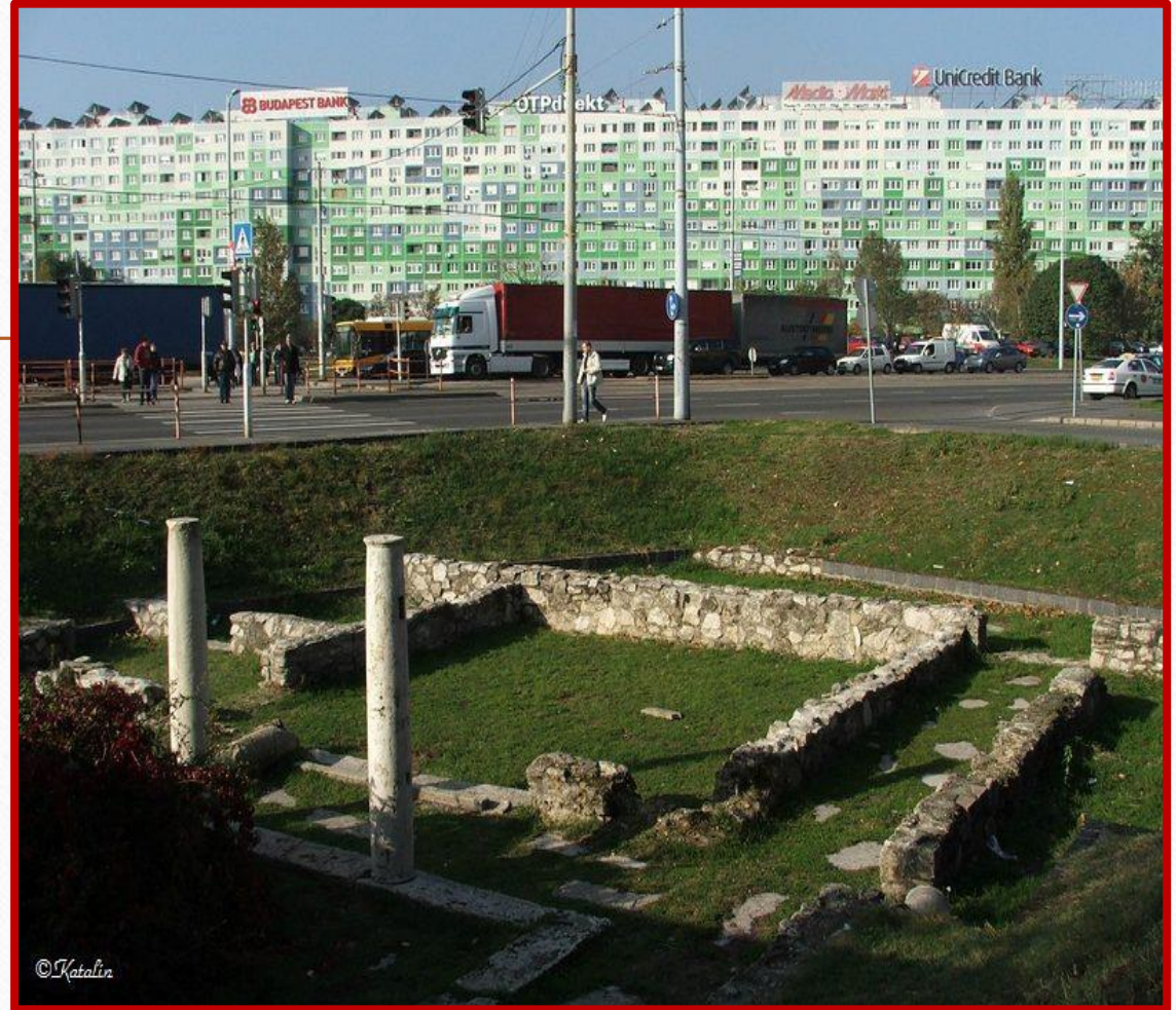
Romok a Flórián téren